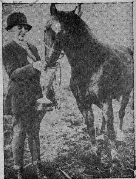
Nadie tiene más derecho a beber en la hermosa copa que "Tangerine", el caballo de silla que la ganó de premio en el concurso del Cavalier Hunt Club, de Virginia Beach, Virginia, Estados Unidos. "Tangerine" ha ganado 87 premios