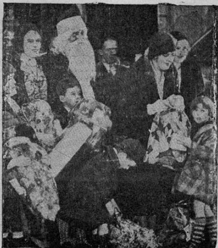
La esposa del Presidente Hoover repartiendo juguetes y dulces a los niños de Washington durante el beneficio de la Misión de la Unión Central de la capital