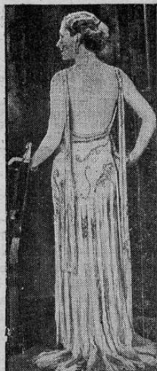
El traje blanco para las reuniones de etiqueta seguirá manteniendo la supremacía. Este bonito traje de chifón blanco, adornado con cuentas de cristal, es una de las nuevas creaciones de la moda